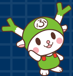
深谷市イメージキャラクター ふっかちゃん